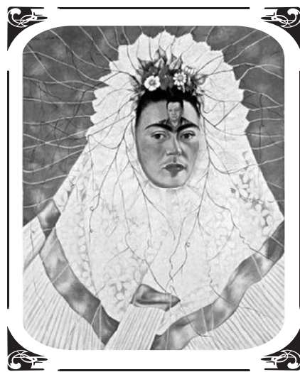
Autorretrato con Diego en mi Pensamiento

el desengaño del que era presa. Autorretrato con Diego en mi Pensamiento , fue terminado en el año 1943, cuatro años después de su separación. En aquel cuadro, Frida lleva puesto un traje de tehuana, típico de una zona de México, traje que a Diego gustaba mucho y que Frida hace conocido en