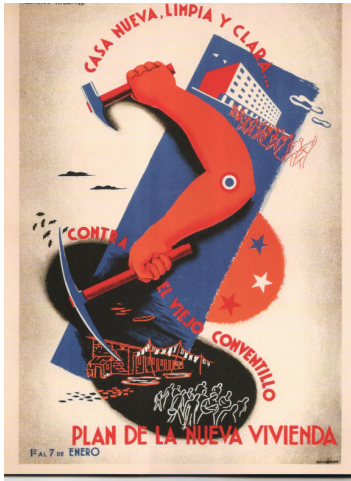
Plan de la nueva vivienda Camilo Mori

Es necesario buscar un mensaje que exprese la idea sintéticamente y se relacione con la interrogante sobre nuestra identidad cultural .