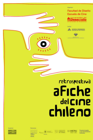
Retrospectiva Afiche del cine chileno

Exponer todos los trabajos, donde cada grupo comente su afiche y el mensaje que transmite.