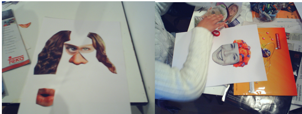
Collage Personajes tradicionales.